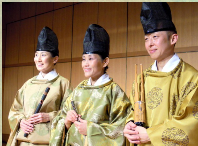
雅楽トリオ 千歳 (ちとせ)

友恵しづねに師事。舞踏カンパニー「友恵しづねと白桃房」メンバー。日本舞踊若柳流師範。東京藝術大学美術学部卒業。日本人のからだをテーマに舞台活動。音楽家、美術家、伝統芸能、演劇など多種ジャンルのアーティスト達とのコラボレーションも多い。 http://www.tomoe.com